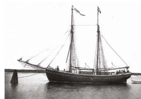
«Bonavista» спущена на воду. 1914 г.