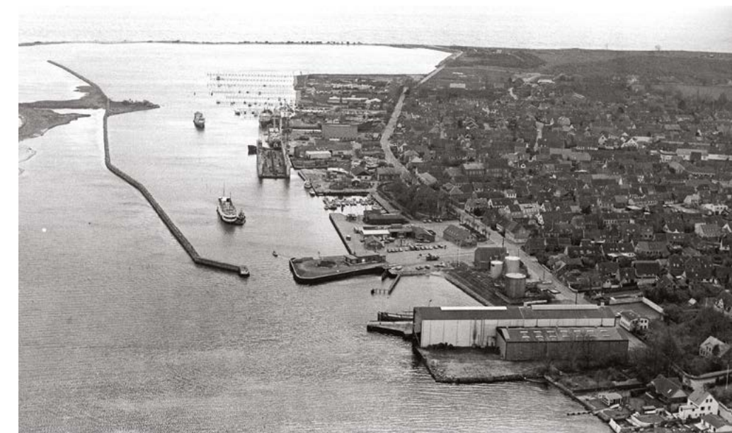
Таким был порт Марсталя в 1990 г.

есть городок Соби — в его порт приходят паромы с Ютландии, есть и с десятков деревень. Дороги хорошие, а вдоль них, как ни странно, бродят фазаны и отдыхают лебеди. Недалеко от Соби, на севере острова можно увидеть старый маяк, едва ли не самый красивый в Дании. Ему 130 лет, он из гранита, круглый в плане. У маяка очень дальний свет. Есть легенда, что маяк строили так, чтобы луч его света был виден в Киле. Как раз незадолго до строительства, в 1864 г. Дания потеряла Шлезвиг и Голштинию, и свет маяка был приветом потерянной земле.