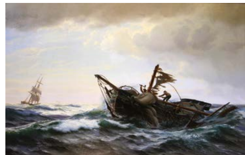
Карл Расмуссен. «Марстальская яхта терпит бедствие в плохую погоду». 1870 г.