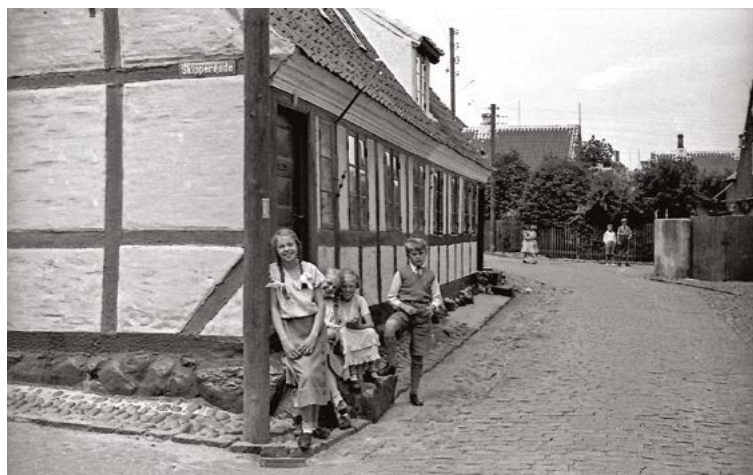
Улица в Марстале в 1935 г.

Капитаны и негоцианты, жившие на Эро, строили дома скромно, себе по росту. Дома невысокие и чаще всего одноэтажные. Людям не надо было многого. Нам понравилась традиция вывешивать старые фотографии, представляющие дом в начале века. Разве это не прекрасный образец сохранения истории?