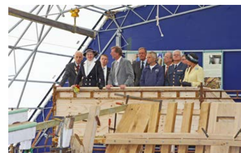
Визит датской королевы на верфь в Марстале

У другого музейного судна «Bonavista» история совсем особенная. В начале XX века после Первой мировой войны более сотни марстальских шхун, которые строились на местных верфях, ходили на лов трески к Ньюфаундленду. Ее ценили как дешевый и полезный продукт долговременного хранения, не требовавший холодильников или консервирования. Многие шхуны на этом пути погибли. «Bonavista», построенная в 1914 году на верфи Йоханссена в Марстале, долго была на ходу,