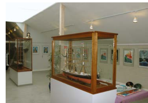
В залах марстальского музея

История Марсталя, его жителей и его морской активности представлена в местном морском музее, где, собственно, и проходила конференция. Музей очень достойный и дает полную картину местного мореплавания, портового дела. Он существует с 1929 г. Экспозиция построена по принципу неспешного рассказа, с выделением отдельных тем. Прелесть музея даже не в присутствии особенно редких вещей, а в том, что вещи эти несут следы жизни людей острова, дома которых надежно стоят до сих пор. Заметна полнота коллекций по местному мореплаванию, они многие годы собирались в частных домах, в пароходствах, а затем плавно перекечевали в музей.