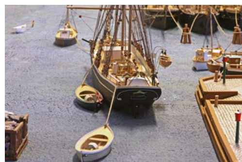
Модель порта Марстала. Баркентина «Hans»