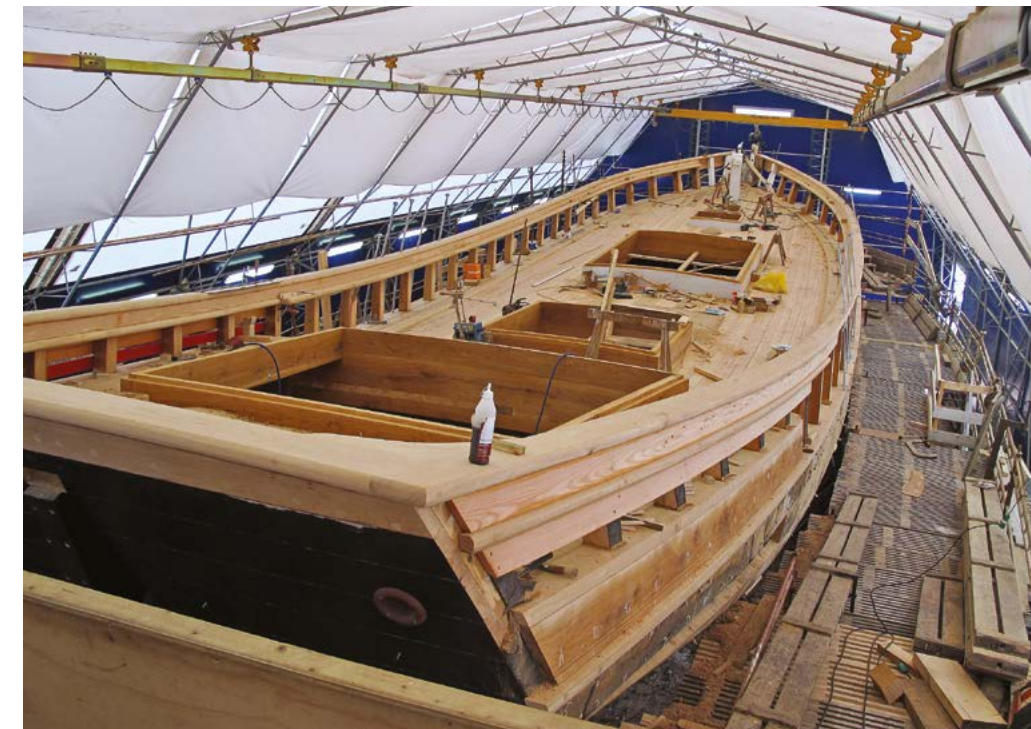
Воссоздание «Bonavista» на временной верфи в 2010 г.

У другого музейного судна «Bonavista» история совсем особенная. В начале XX века после Первой мировой войны более сотни марстальских шхун, которые строились на местных верфях, ходили на лов трески к Ньюфаундленду. Ее ценили как дешевый и полезный продукт долговременного хранения, не требовавший холодильников или консервирования. Многие шхуны на этом пути погибли. «Bonavista», построенная в 1914 году на верфи Йоханссена в Марстале, долго была на ходу,