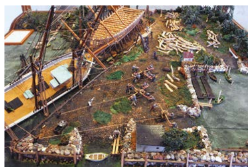
Модель верфи, принадлежащей семье Кристенсен, по состоянию на 1900 г. Исполнена Лоренцом Хансененом