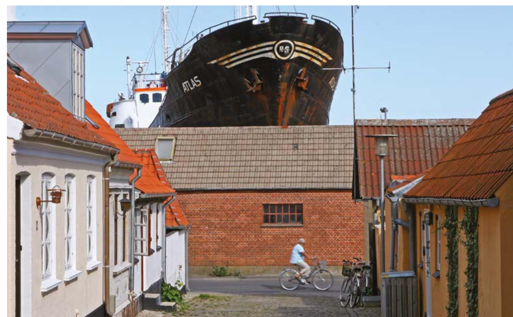
Проезд на острове. На заднем плане каботажное судно «Atlas»

В датских старых домах много окон, они со всех четырех сторон и не занавешены. Дом виден насквозь, зато света всегда много. А это важно для северного края. У домов часто стоят старые, массивные якоря, в основном адмиралтейский и якорь Холла. Что ж, понятный знак, говорящий о присутствии в доме людей морской профессии. В окнах, сверкающих чистотой в преддверии курортного сезона, часто видны фигурки датского фарфора, небольшие морские вещицы.