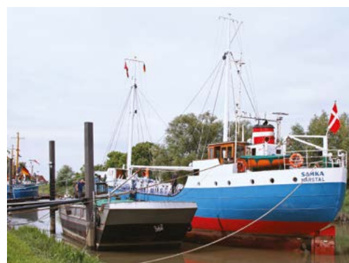
«Samka» в дружественной гавани морского музея Вишхафена на Нижней Эльбе (Германия)