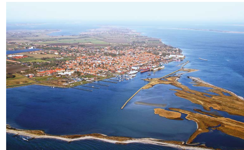
Современный вид на город Марсталь и его порт

Город сказочно красив и удивляет цельностью своего облика. Размером с небольшой поселок, это тем не менее полноценный город с ратушей, кирхой и мостовой. Еще на острове