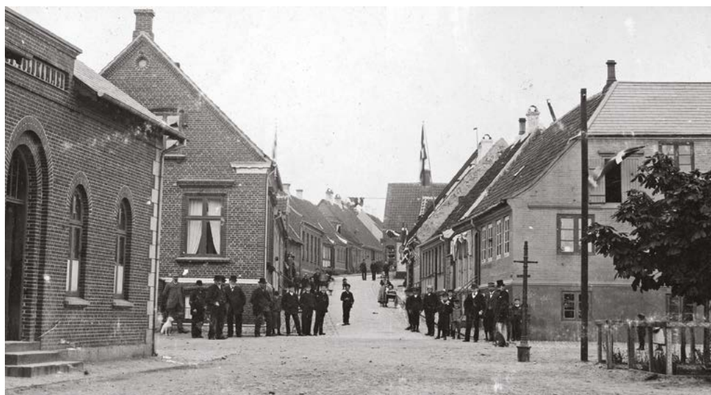
Портовая улица в Марстале. В здании справа сегодня располагается музей