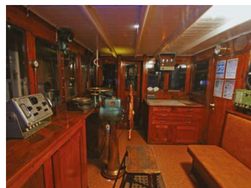
В марстальском музее. Рубка каботажного судна «Doga», идентичного судну «Samka»