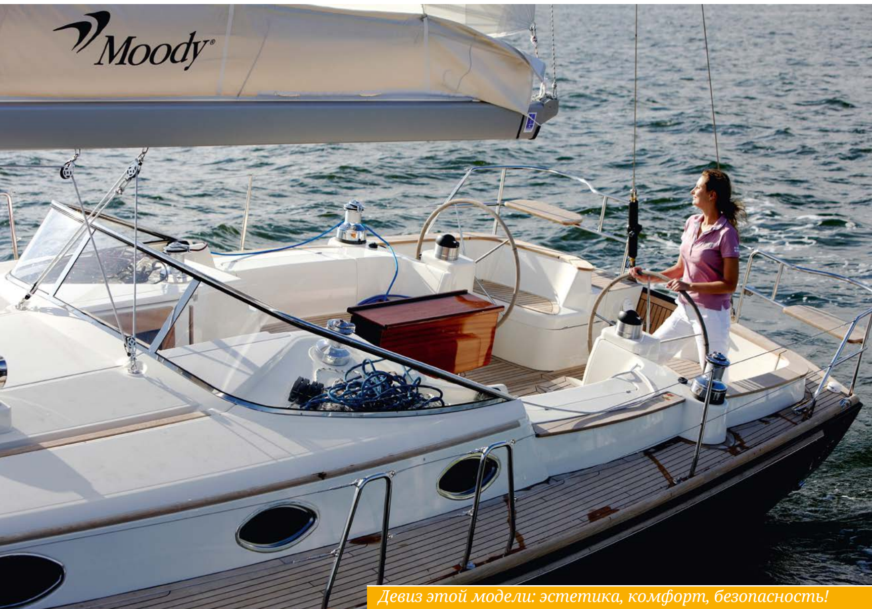
Девиз этой модели: эстетика, комфорт, безопасность!

Совсем другое впечатление производит яхта на воде. Порода видно издали! В профиль это типичная английская яхта середины прошлого века (не слишком давно): невысокая, но ярко выраженная надстройка, классические овальные хромированные иллюминаторы, широкие бортовые проходы, вентиляционные гуськи на надстройке, гнущее ветровое стекло перед входом в салон. Небольшой фальшборт вокруг кокпита придает профилю классичности и добавляет безопасности. Планировка кокпита отсылает нас также в 60-е годы. Просторно, абсолютно нет прямых углов, места рулевого выделены из общего объема. А о том, чтобы «списаться» за борт, здесь речи вообще не идет. Рулевой всегда чувствует себя защищенным.