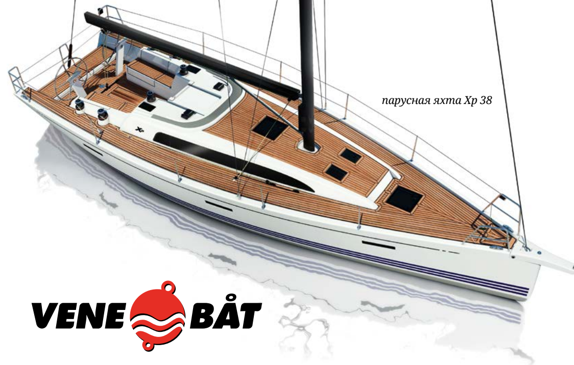
парусная яхта Xp 38