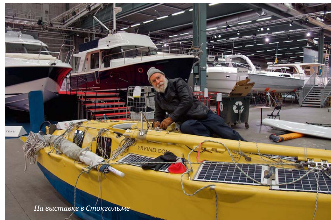
На выставке в Стокгольме