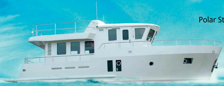
Polar Star M47

Надежные стальные моторные яхты траулерного типа длиной до 70 футов для семейных путешествий и бизнес-встреч. Технология semi-custom позволяет заказчику реализовать свой вариант планировки с просторными каютами, оснастить судно двигателями желаемой мощности и требуемым навигационным оборудованием