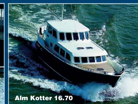
Alm Kotter 16.70