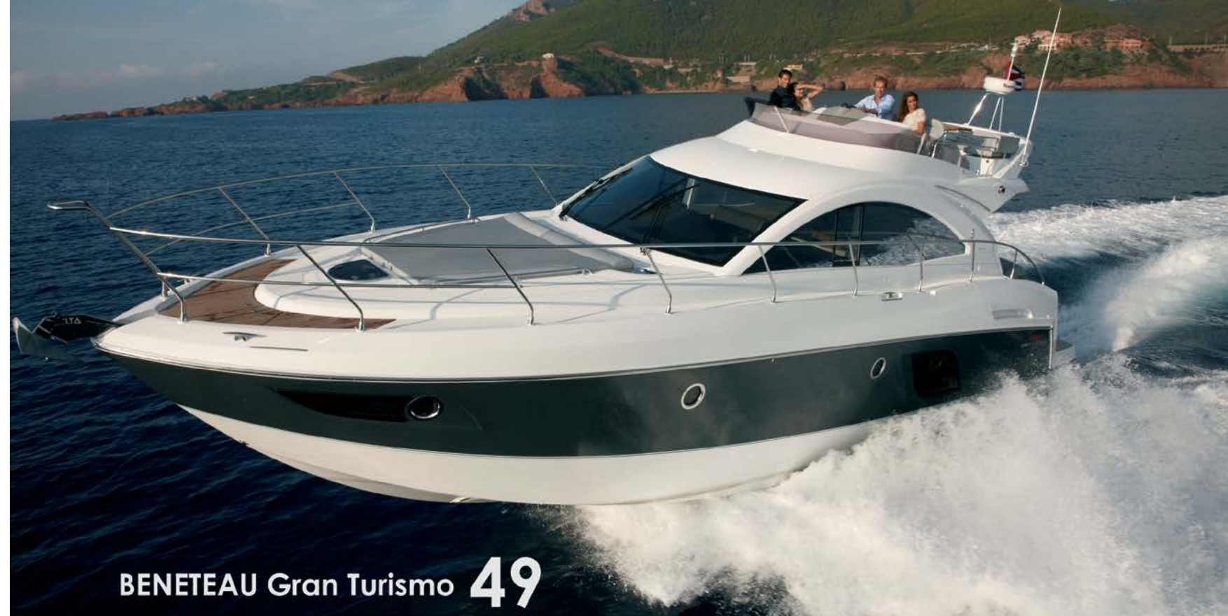
BENETEAU Gran Turismo 49