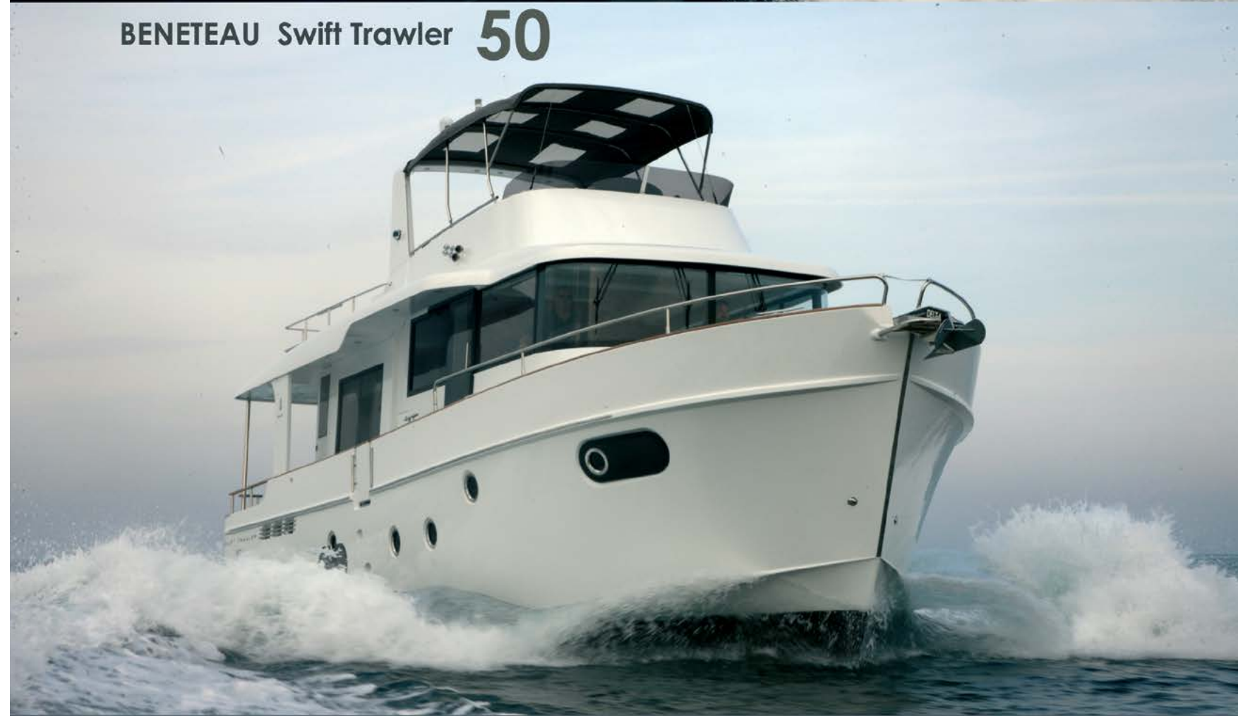
BENETEAU Swift Trawler 50