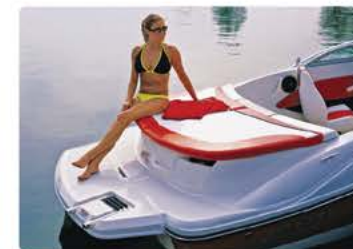
Купальная платформа и матрас для загара