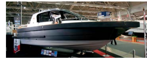
На базе модели-трансформера APB 27 финская верфь Magino создала открытый тендер для мегаяхт (фото справа)

Финская верфь Grandezza представила сразу три новые модели и одну модифициро-