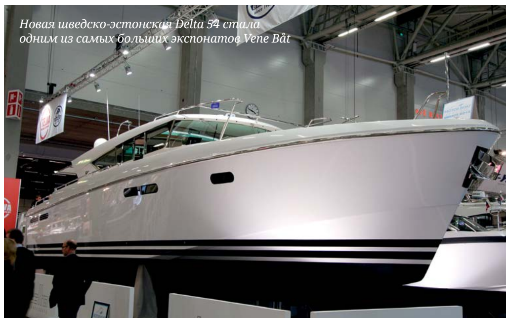
Новая шведско-эстонская Delta 54 стала одним из самых больших экспонатов Vene Bät