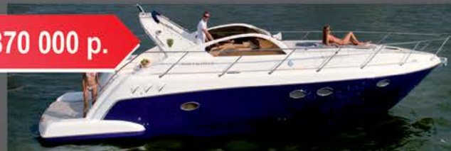
Velvette 41 Evolution