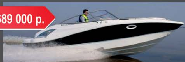
Velvette 25 Euphoria