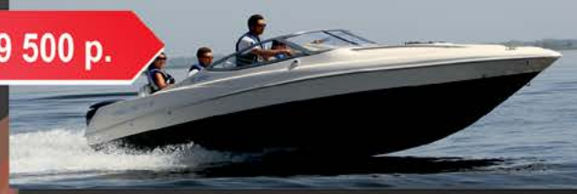
Velvette 20 Image