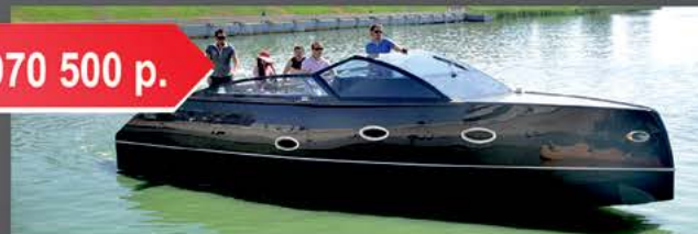
Velvette 33 Intelligent

Длина 10.12 м Ширина 3.2 м Пассажиров 10