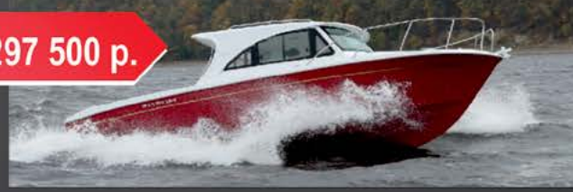
Velvette 23 Active Sedan