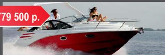
Velvette 29 Envy