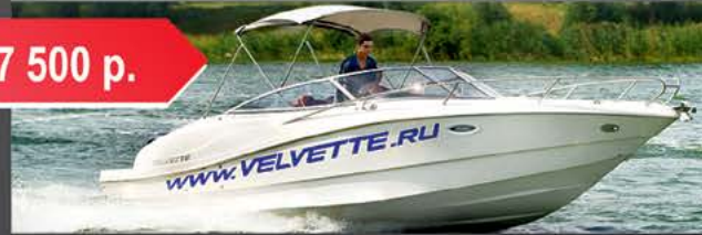
Velvette 24 Euphoria