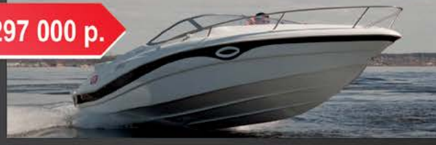
Velvette 22 Image