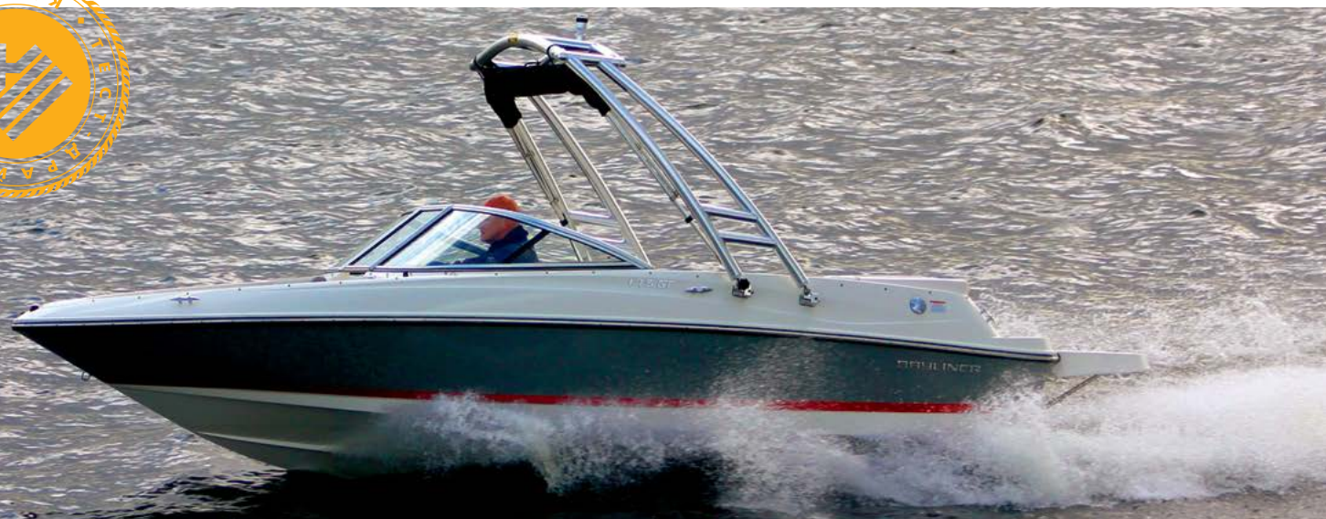
Bayliner 175 GT

К атера и мотолодки Bayliner одними из первых проникли на отечественные просторы после падения «железного занавеса» и надолго стали здесь одним из наиболее ярких символов американского ботинга. Впрочем, времена меняются, и в последнее время марка все чаще склоняется к приоритетам европейского покупателя — даже цифровые индексы некоторых моделей отражают теперь не привычные за океаном футы, а метры. Новинки новинками, но Bayliner отнюдь не спешит расстаться и с бестселлерами прошлых лет, в очередной раз доказывая, что простор для улучшений и усовершенствований оставляют даже многократно проверенные и завоевавшие высокую популярность модели.