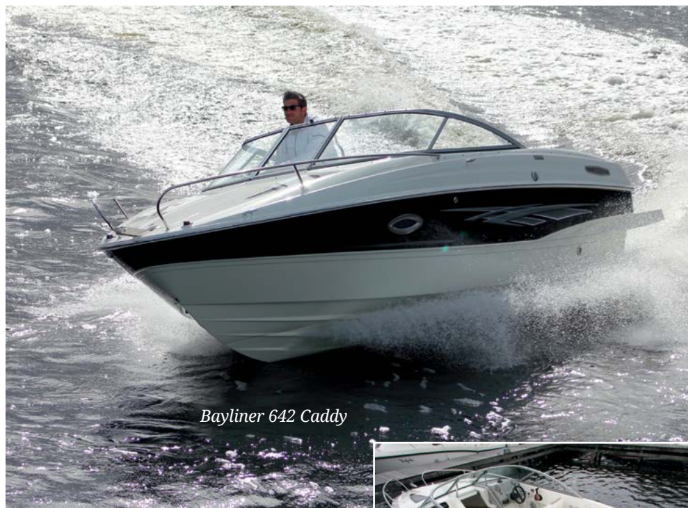
Bayliner 642 Cuddy

В передней части бокового дивана — откидная спинка. На ходу она находится в кормовом положении, отделяя от дивана пассажирское кресло. А на стоянке спинку