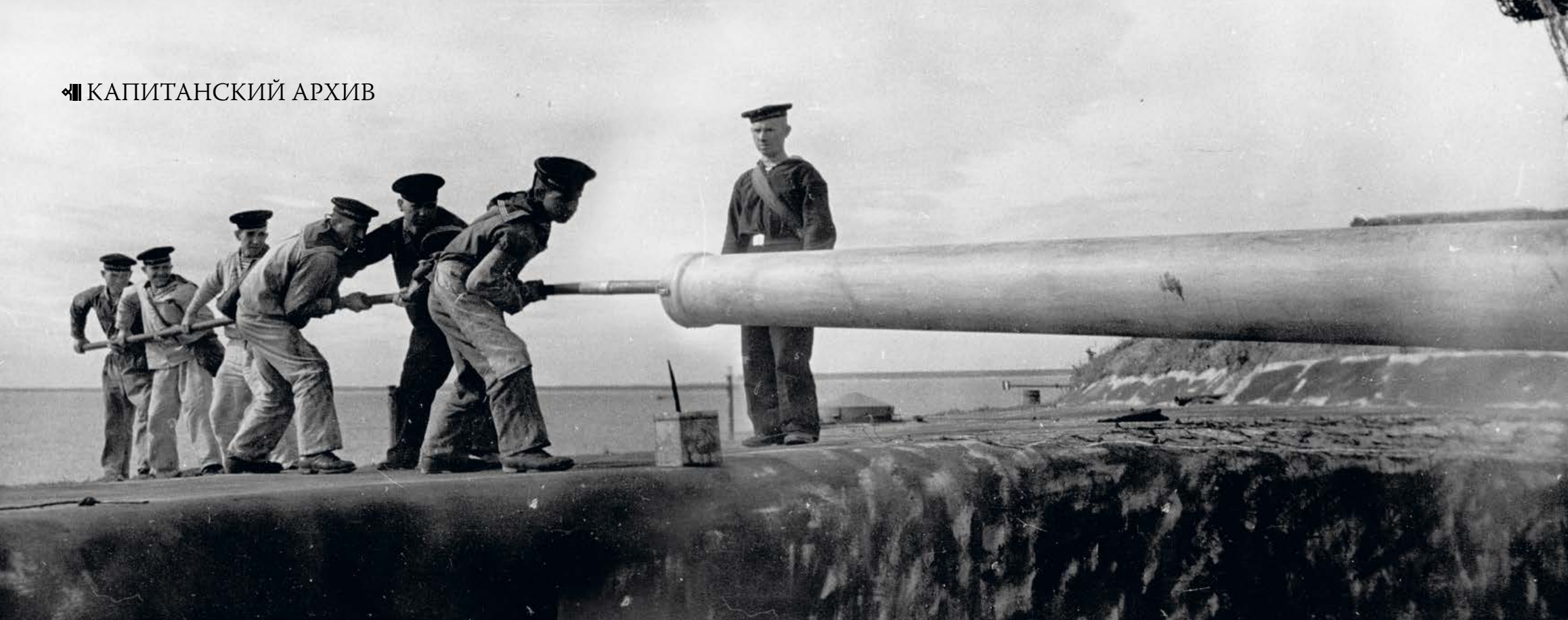
Чистка орудия на батарее №114 форта Тотлебен. 22.06.1942 г.