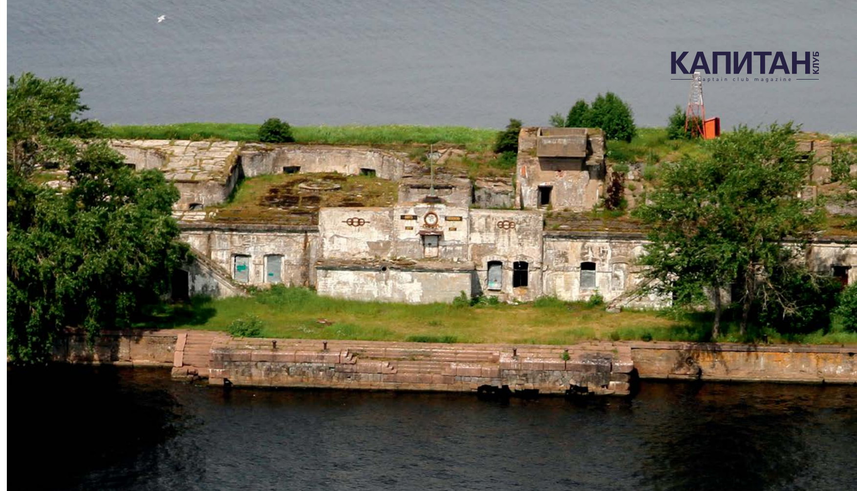
Главная пристань и аттик форта Тотлебен