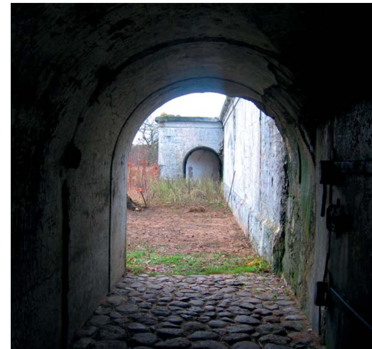
Каменная вымостка 1913 года, восстановленная Владимиром Ткаченко. Вахта 2011 года

Но были люди, накопившие обиды на коменданта, пресекающего попытки устра-