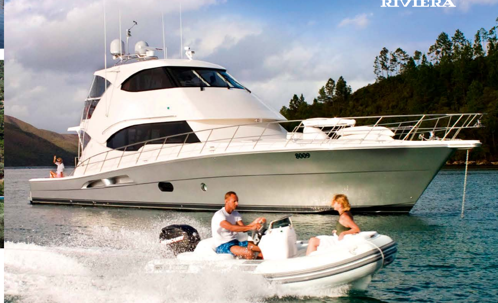
75 Flybridge Yacht