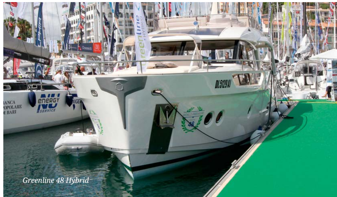
Greenline 48 Hybrid

вам», она приформовывает переборки и элементы мебели к обшивке и палубе — яхты ходят по всем океанам и огибают мыс Горн без проблем. И парусами они нагружены не хуже чисто гоночных: энерговооруженность One 58 — 5,14! Самое интересное в подпалубной планировке — камбуз: он вынесен к подмачтовой переборке и занимает всю ширину яхты (еда для итальянца — святое). А напротив обеденной группы раскинулся шикарный диван, где можно и сесть с комфортом, и лечь с удовольствием. >>>