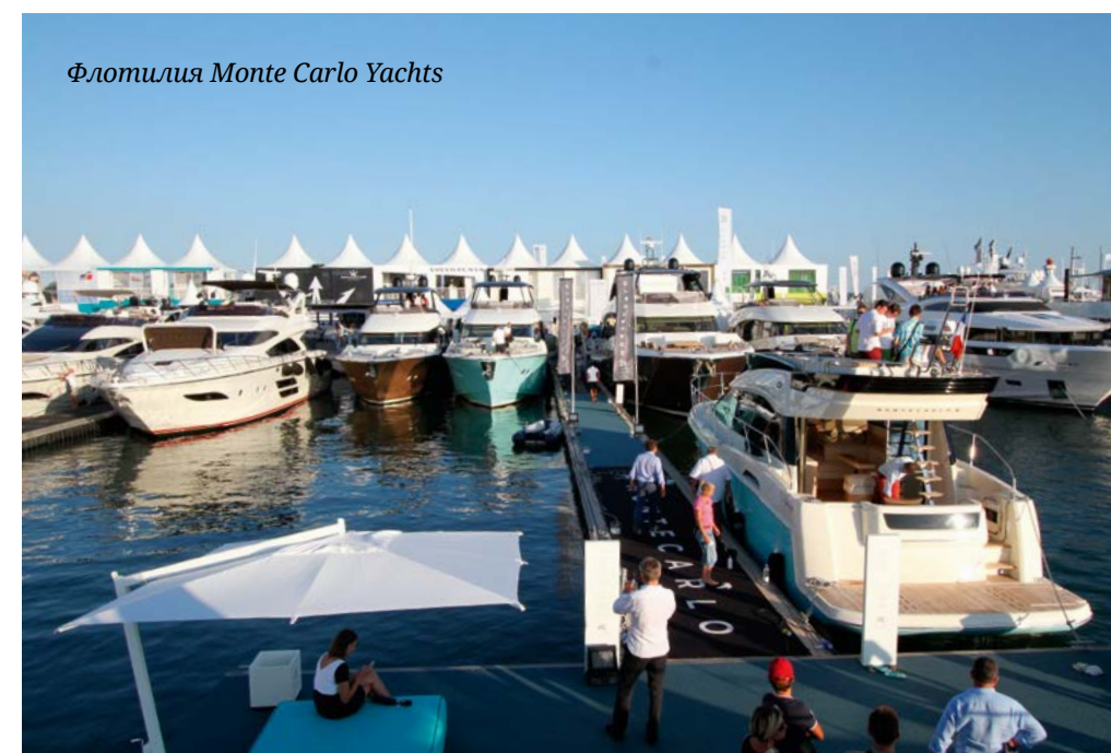
Флотилия Monte Carlo Yachts