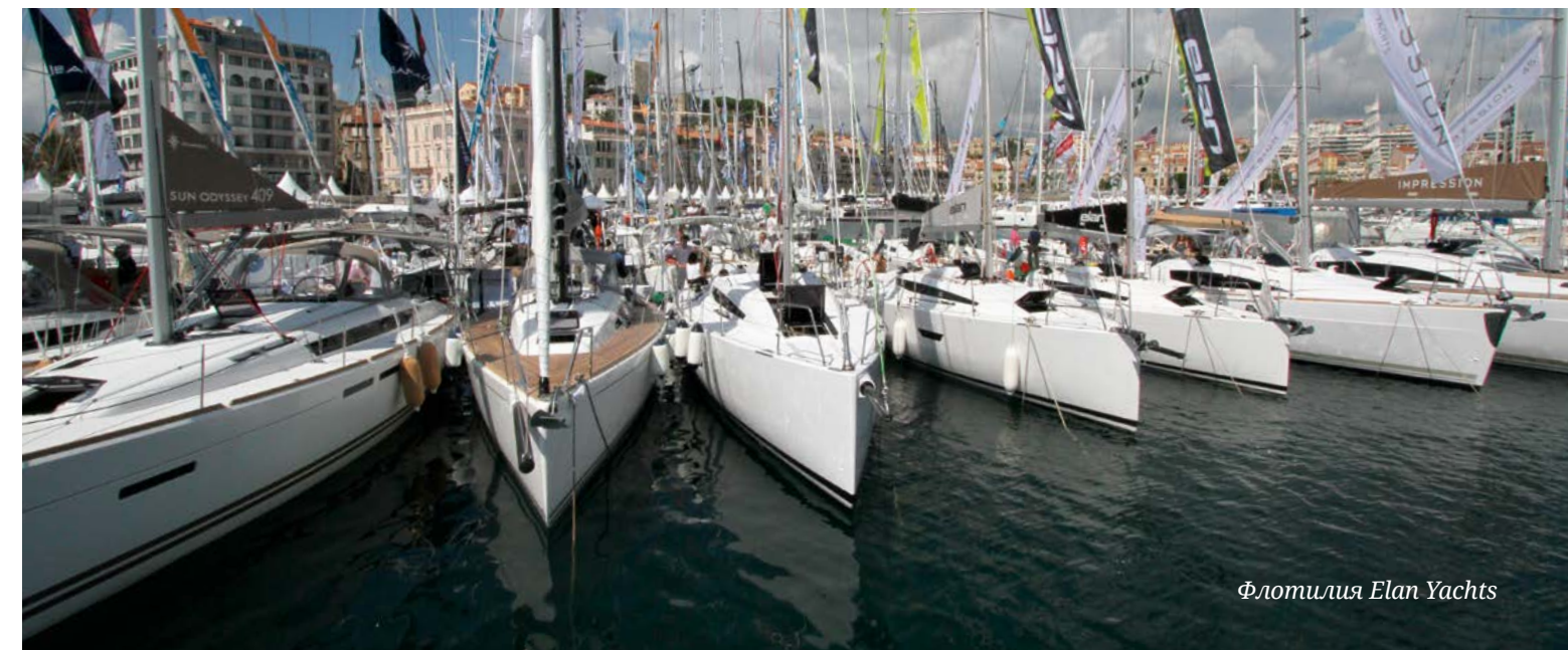
Флотилия Elan Yachts

Парусные лодки на выставке составили 21% от всех экспонируемых — 115 «бортов». И хотя официальный пресс-релиз организаторов и называет все эти суда новыми, но большинство из них нам так или иначе знакомы. Некоторые были презентованы еще в Дюссельдорфе, другие просто получили новые имена (чистый маркетинг), какие-то известные модели предстали в новых модификациях (с хардтопом, в спортивной версии, с альтернативными планировками).