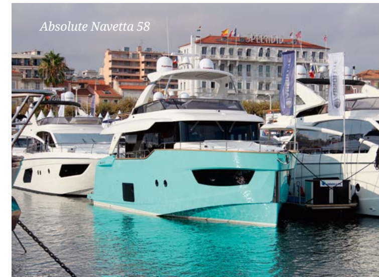
Absolute Navetta 58

На выставке царили привычный ажиотаж и бурление народа. Потенциальные клиенты, туристы и профессионалы рынка пытались объять необъятное и посмотреть каждую яхту, каждый катер и, разумеется, записаться на все тест-драйвы сразу. Судя по тому, с какой частотой сновали туда-сюда суда, под завязку забитые народом, многим это удавалось. Новинки в этом году было невероятное количество. Гранды индустрии выступали с рекордными по размеру стендами и рекордным количеством выставленных яхт.