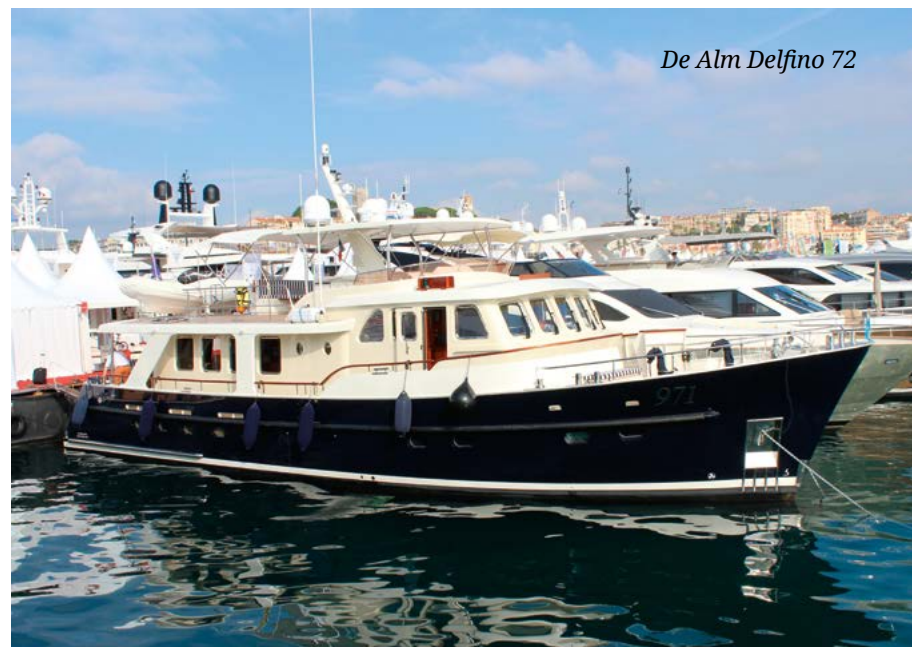
De Alm Delfino 72