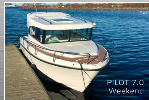
PILOT 7.0 Weekend