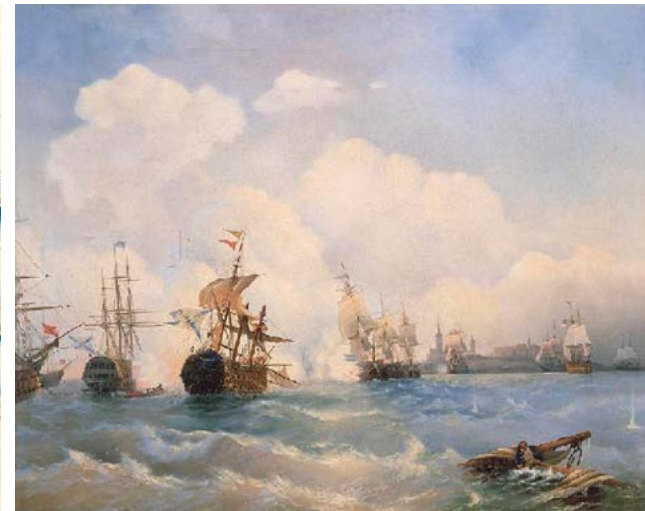
«Ревельский бой 2 мая 1790 г.» кисти Алексея Боголюбова (сверху) и диспозиция шведских и русских кораблей во время этого сражения (слева)

Важным событием этой войны стало Ревельское сражение 1790 года. 2 мая шведская эскадра из 20 линейных кораблей и семи фрегатов атаковала русскую эскадру (десять линейных кораблей и пять фрегатов) адмирала В. Я. Чичагова, стоявшую на Ревельском рейде. Шведы, проходя вдоль линии русских кораблей, вели сильный артиллерийский огонь. Но ответная стрельба наших командоров была еще сильнее. Шведский корабль «Принц Карл» получил тяжелые повреждения и сдался в плен, еще один корабль выбросился на камни и был сожжен командой. В итоге шведы вышли из боя, потеряв около 150 человек убитыми и 520 пленными; русские потеряли восемь человек убитыми и 27 ранеными.