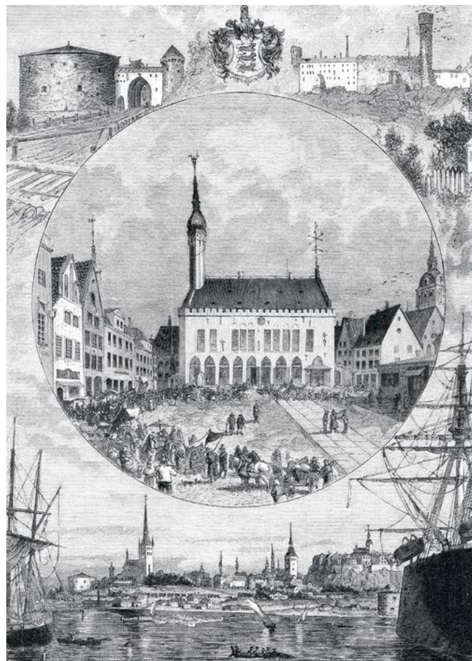
Виды Ревеля. Гравюра М. Рашевского с оригинальных рисунков с натуры Р. Шейна. Конец XIX в.

К началу Северной войны (1700 г.) шведы устроили военную гавань для своего флота и водопроводы, служившие для снабжения города и форштадта водой. Одновременно были заложены бовверк и несколько приморских батарей, выдвинутых к морю для непосредственной защиты военного порта. Однако начавшаяся война с Россией не позволила шведам закончить морские укрепления Ревеля. 4 июля 1710 года русские войска вступили в Ригу, затем захватили Пернов (Пярну) и Аренсбург (Курессааре). В декабре 1709 года войска генерала Боура подступили к Ревелю. Перекрыв канал, они оставили гарнизон и жителей без воды. Артиллерийский обстрел и начавшаяся чума помогли захватить город, и с этого момента вся Лифляндия и Эстляндия перешли под власть России.