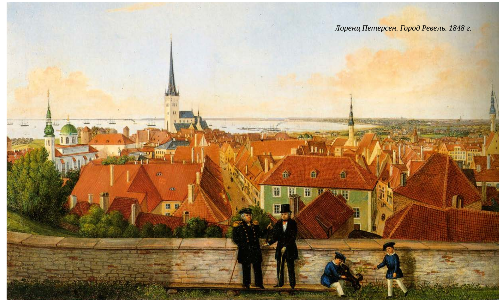
Лоренц Петерсен. Город Ревель. 1848 г.

Вторая половина XIX века в Ревеле, как и во всей Европе, прошла под знаком стремительного развития промышленности и торговли. Однако поиски новой базы для развивающегося российского флота продолжались и в итоге привели к созданию уникальной Морской крепости Императора Петра Великого. Но об этом — в следующих номерах... ❏