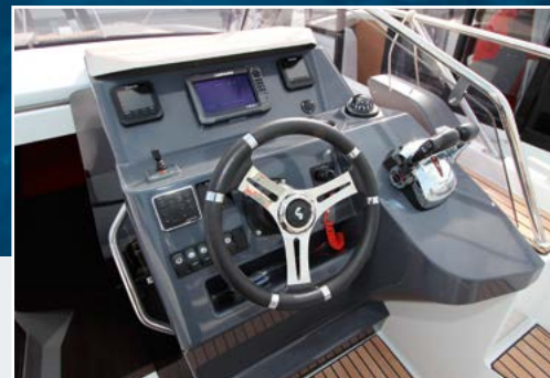
Beneteau Flyer 8.8 SUNdeck