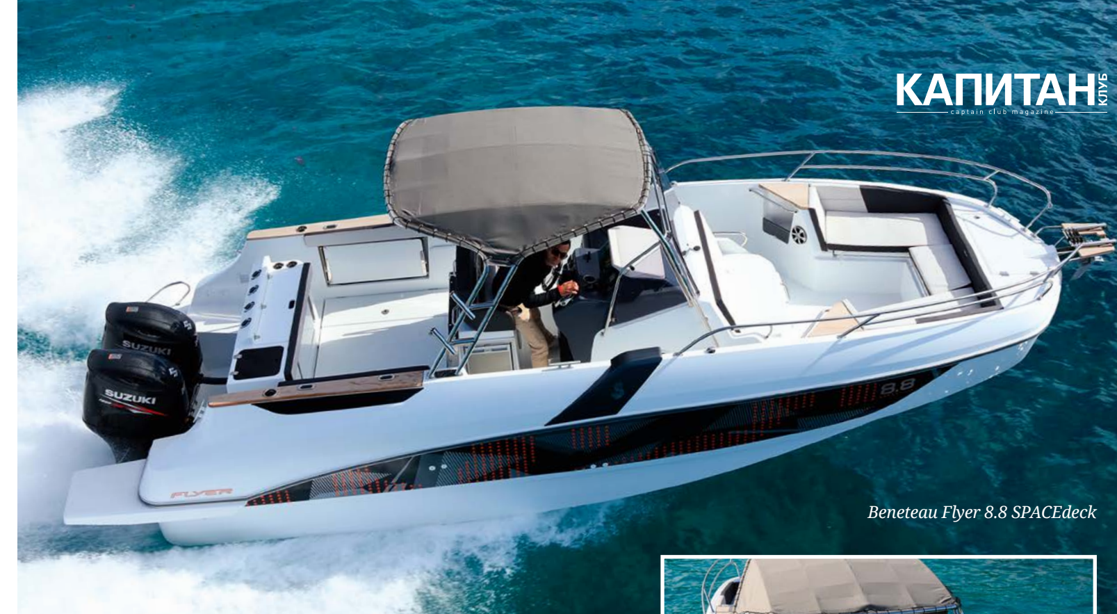
Beneteau Flyer 8.8 SPACEdeck

Теперь — о планировках моделей. SPACEdeck — фактически боурайдер, с просторным вторым кокпитом в широченном носу. В его центре ставится стол, где можно полноценно отобедать, пока мужчины на корме рыбу ловят. А после обеда пространство между тремя сиденьями за-