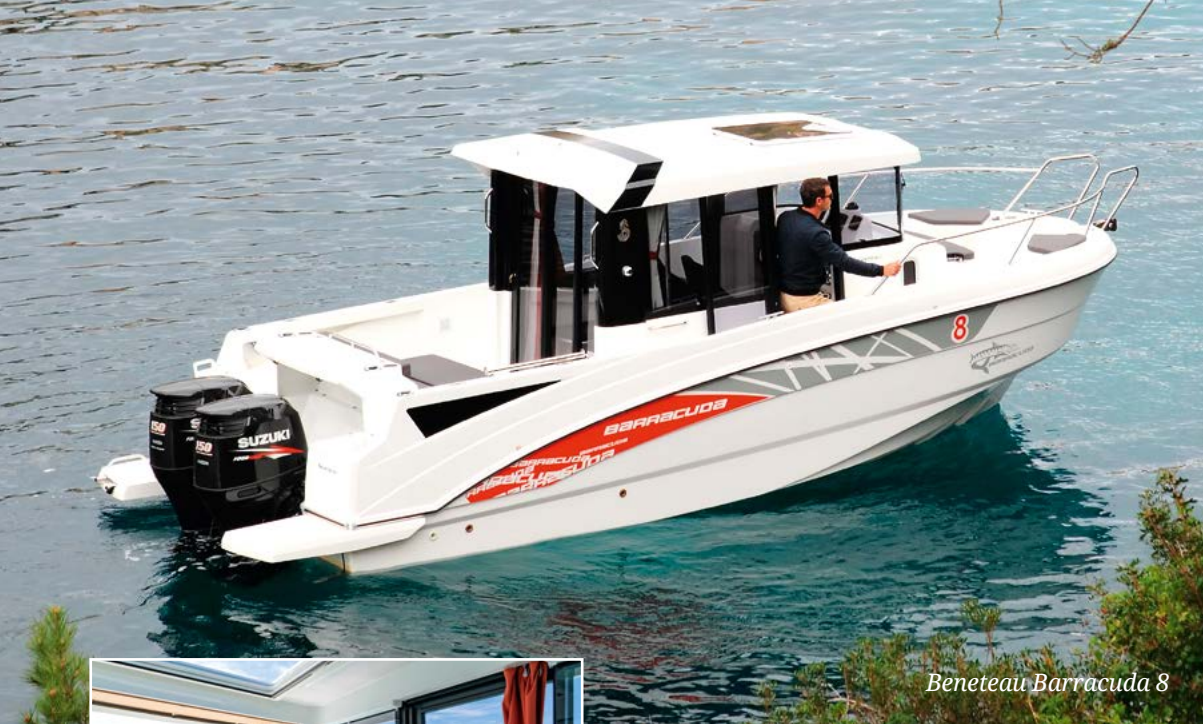
Beneteau Barracuda 8