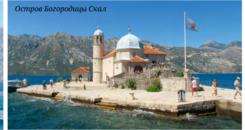
Остров Богородицы Скал