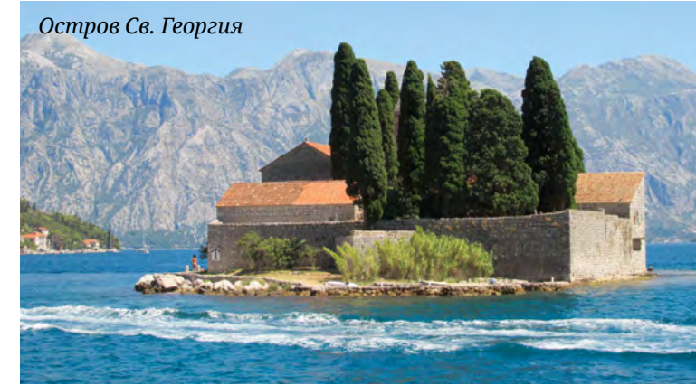
Остров Св. Георгия