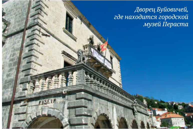
Дворец Буйовичей, где находится городской музей Пераста